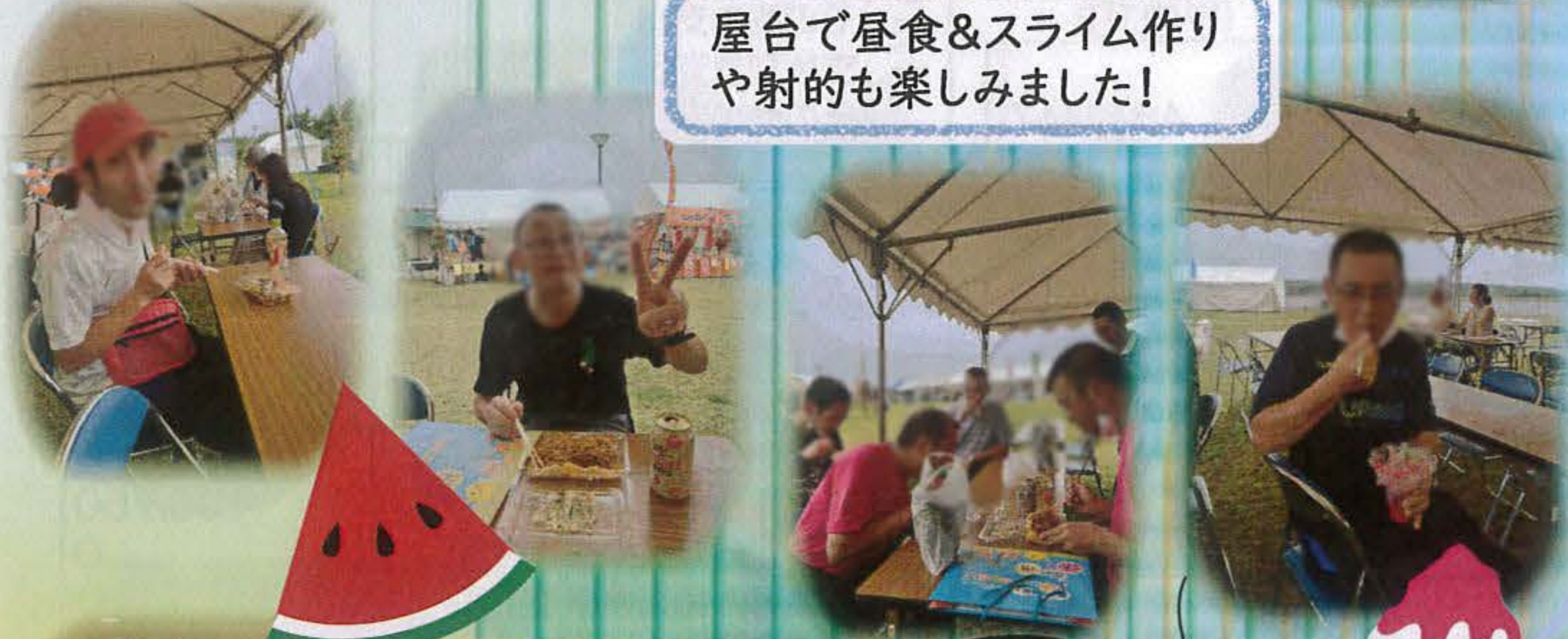
屋台で昼食&スライム作りや射的も楽しみました!