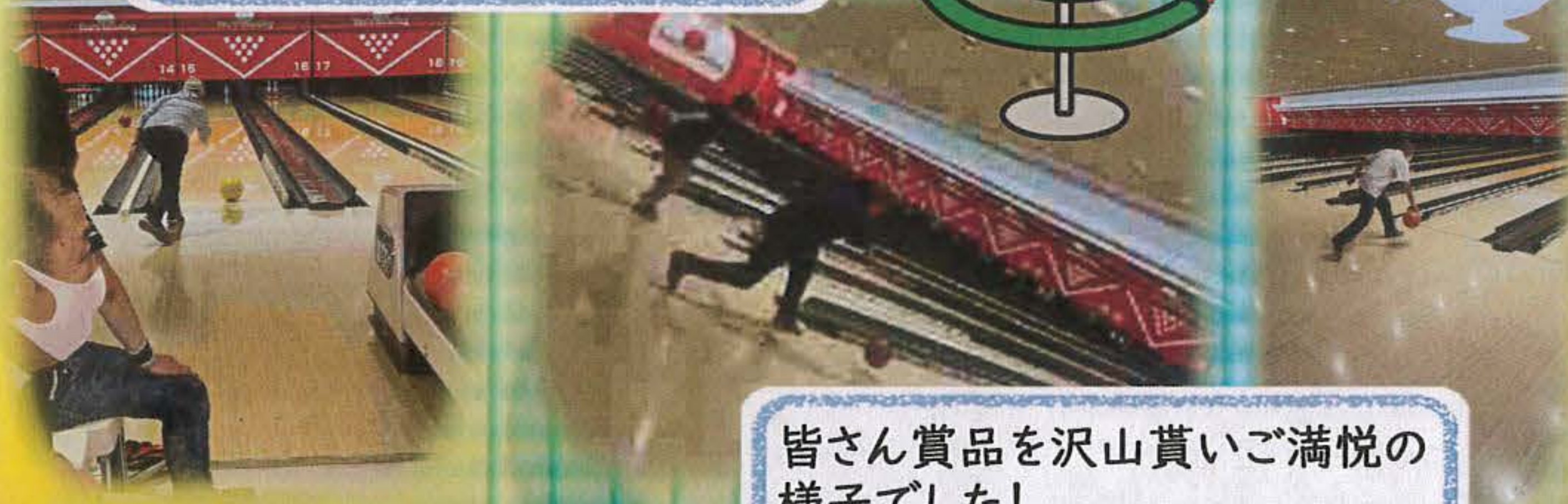
皆さん賞品を沢山貰いご満悦の様子でした!