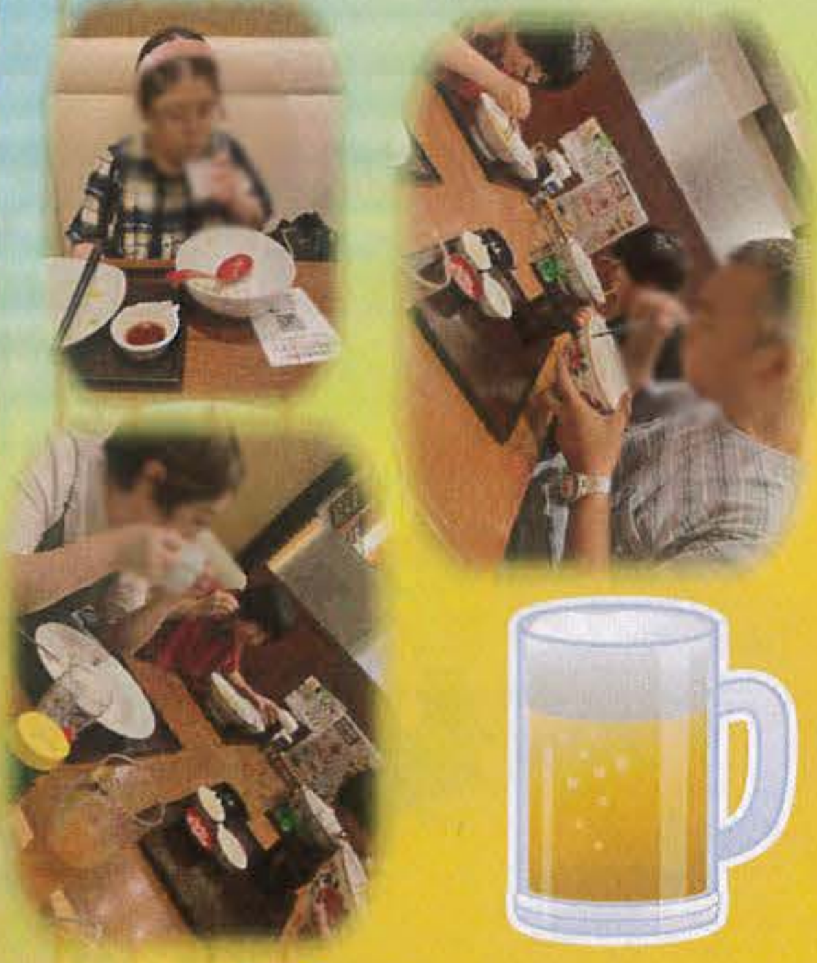
イオン下田に食事外出! 美味しそう!